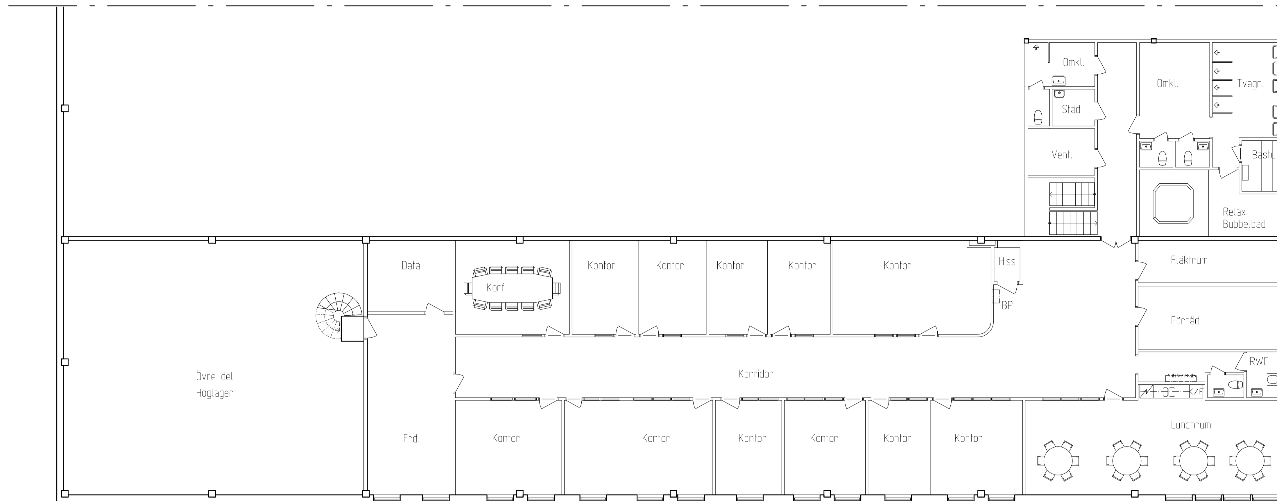
Plan 1 tr